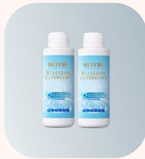
2x NS0016 潔淨洗劑 - 125ml