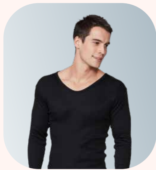
UW158 親柔男長袖內衣 - 黑色