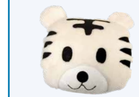
非賣品 SA803 如意虎 - 米白 *送罄為止