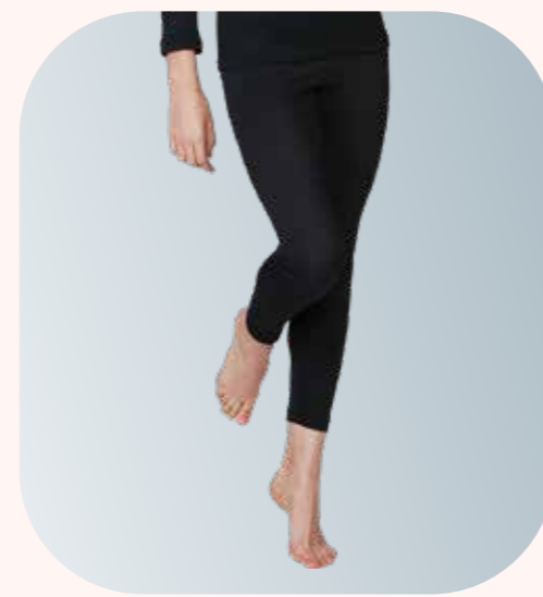
UW157 親柔女長內褲 - 黑色