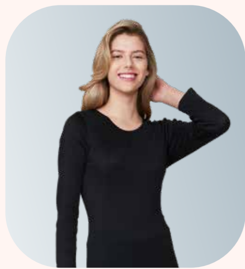
UW156 親柔女長袖內衣 - 黑色