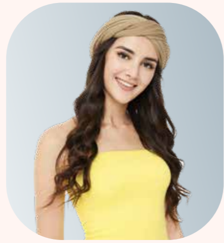
AS034 輕逸披肩 - 橄欖綠， 170 x 79cm