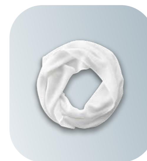
AS001 萬用方巾(兩條裝) - 白色，60 x 17cm