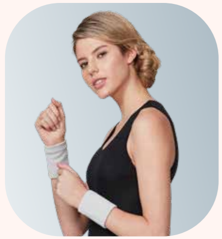
AS016 妮美龍護腕 (長版) - 灰色，M