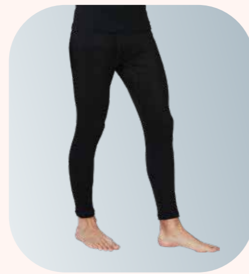
UW159 親柔男長內褲 - 黑色