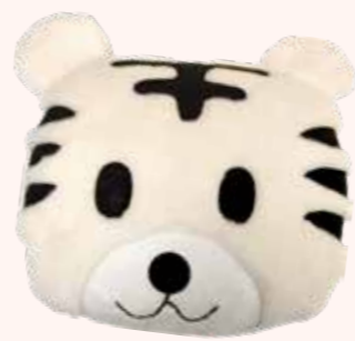
非賣品 SA803 如意虎 - 米白 *送罄為止