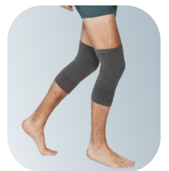
SG012 悠活護膝(一雙裝) - 深灰，M 或 L